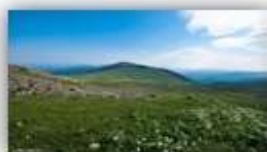
Альпийские уральские луга