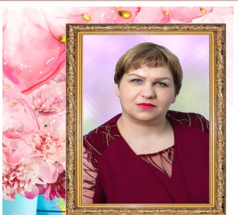
Я директор МОБУ ООШ №21 д. Новобалтурина